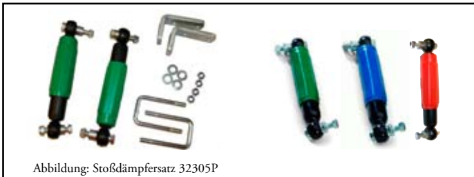
Abbildung: Stoßdämpfersatz 32305P