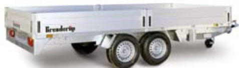
Bestell Nr. 31475A-DP

Kasten Innen: 518x204x34 cm Ges. Maße: 649x210 cm Bordwände: Alu Ges. Gewicht: 2500 kg Nutzlast: 1755 kg Bereifung: 14" Bremse: Ja