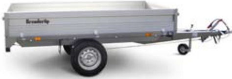
Bestell Nr. 44117P

Kasten Innen: 259x143x35 cm Ges. Maße: 417x149 cm Bordwände: Alu Ges. Gewicht: 1200 kg Nutzlast: 950 kg Bereifung: 13" Bremse: Ja