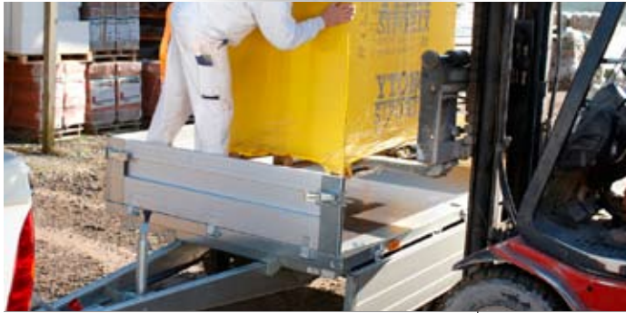
Bestell Nr. 44133P