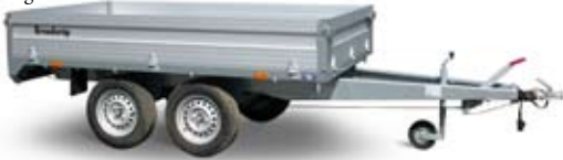
Bestell Nr. 44127P

Kasten Innen: 259x143x35 cm Ges. Maße: 417x149 cm Bordwände: Alu Ges. Gewicht: 1500 kg Nutzlast: 1170 kg Bereifung: 13" Bremse: Ja