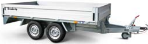
Bestell Nr. 31469PA-D

Kasten Innen: 309x180x34 cm Ges. Maße: 445x186 cm Bordwände: Alu Ges. Gewicht: 2500 kg Nutzlast: 1990 kg Bereifung: 14" Bremse: Ja