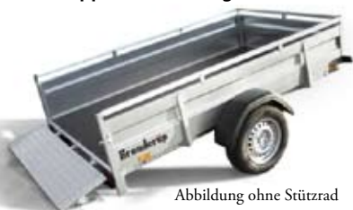
Abbildung ohne Stützrad

Kasten Innen: 258x153x40 cm Ges. Länge: 405x204 cm Bordwände: Stahl Ges. Gewicht: 1300 kg Nutzlast: 982 kg Bereifung: 14" Bremse: Ja