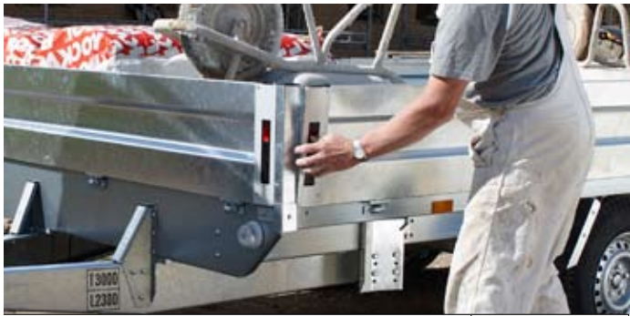
Bestell Nr. 31454A-DP