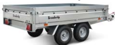
Abbildung ohne Stützrad

Kasten Innen: 250x142x35 cm Ges. Maße: 412x149 cm Bordwände: Stahl Ges. Gewicht: 1000 kg Nutzlast: 750 kg Bereifung: 10" Bremse: Ja