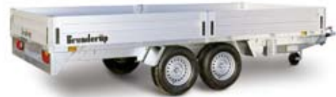
Bestell Nr. 31471A-DP

Kasten Innen: 418x203x34 cm Ges. Maße: 549x210 cm Bordwände: Alu Ges. Gewicht: 2500 kg Nutzlast: 1835 kg Bereifung: 14" Bremse: Ja